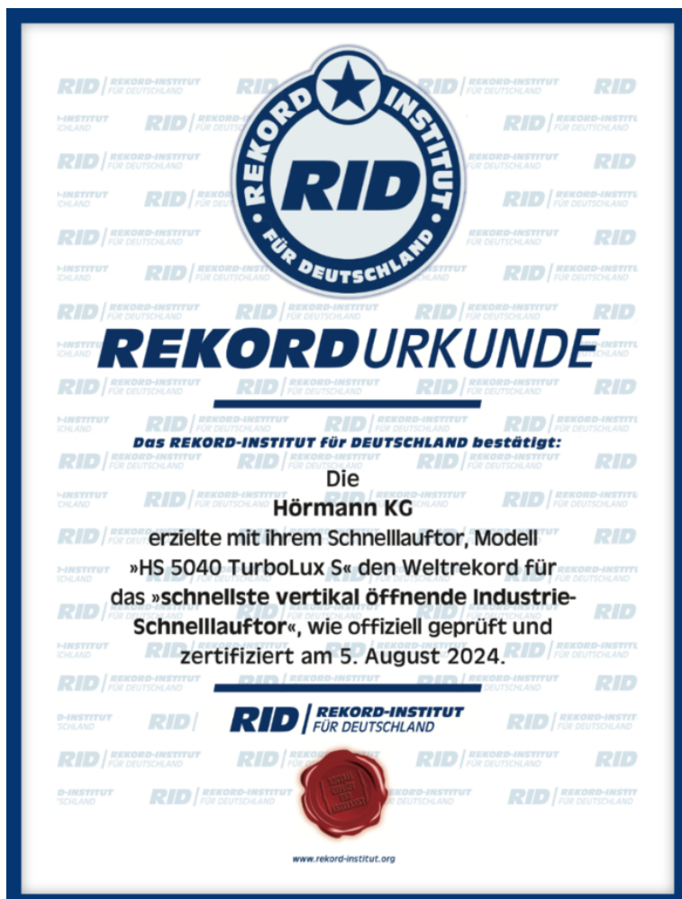
2.kép: A Rekord-Institut für Deutschland tanúsítványa igazolja: a Hörmann HS 5040 TurboLux S a világ leggyorsabb függőleges nyíló ipari gyorskapuja.

Hörmann KG Verkaufsgesellschaft Kapuk · ajtók · ipari kapurendszerek