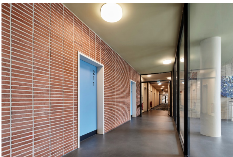
6. kép: A szálloda folyosói a felújítás után is megőrizték eredeti bájukat.